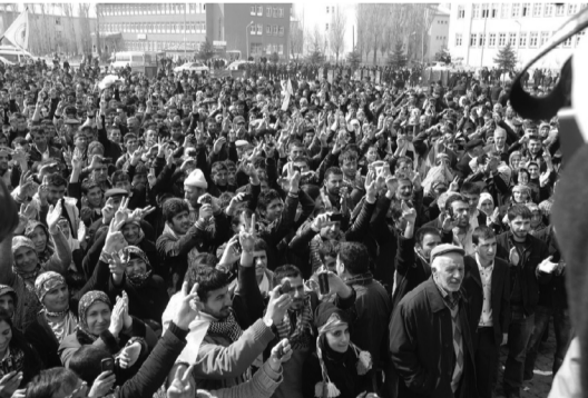
21 Mart 2012 Newroz-Diyarbakır