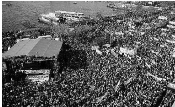
31 Mart 2012 Kadıköy Mitingi