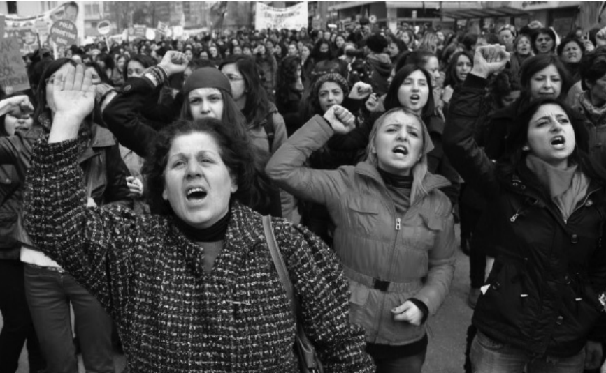
8 Mart 2012 Mitingi

Devlet tekeli kapitalizmi ise hegemonların niyet ve amaçlarına uygun alt-emperyalist/küçük-emperyalist kimliği ile bu hengâmede kendisine sunulacak kırıntılara iştahını kabartıyor. Emperyalizmin çı-