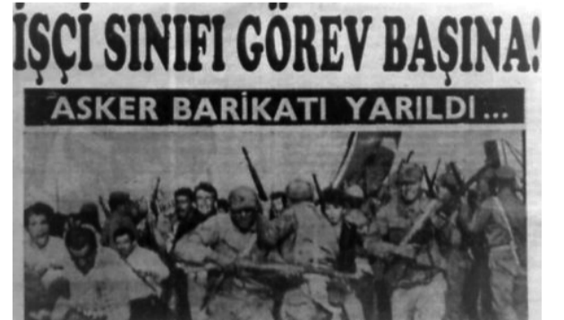
15-16 Haziran 1970