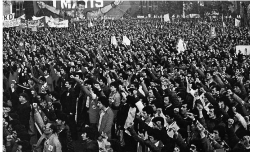
1 Mayıs 2011 Taksim Mitingi